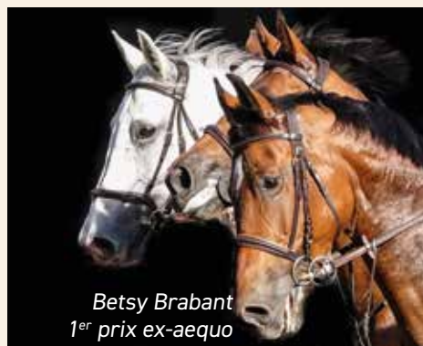
Betsy Brabant 1 er prix ex-aequo