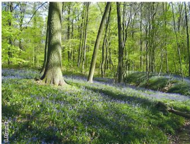
Hêtraie à jacinthe des bois

Un habitat Natura 2000 est un milieu rare, menacé ou remarquable à l'échelle européenne. En Wallonie, ces habitats sont regroupés en unités de gestion (UG) nécessitant des mesures 1 pour les maintenir dans un état de conservation favorable. La liste des principaux habitats Natura 2000 présents dans ce site sont: